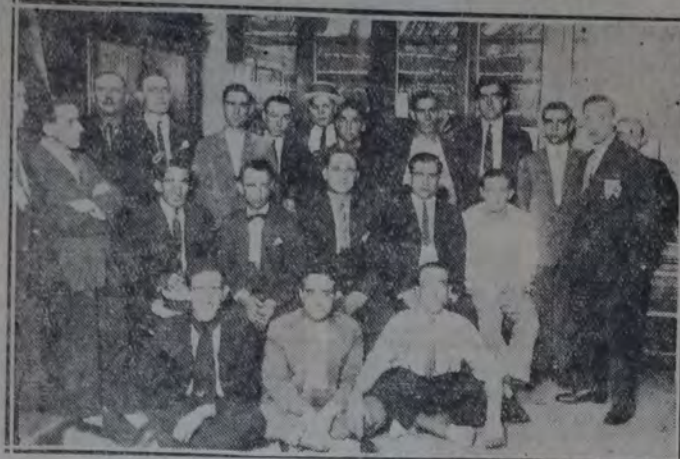
Miembros del comité central de propaganda de la rama de cromohojalatería y delegados sindicales

agravio al decoro de los obreros que explota, cuando pasa por encima de delegaciones que los mismos designan, y más aún, confirma descaradamente su creencia de que el trabajo es una mercancía. Si así no fuera, respetaría los acuerdos del mismo personal, y con educación contestaría a los trámites en la forma que caracteriza a las personas correctas. A pesar de todas esas artimañas, la asamblea se realizó lo mismo. El personal reunido censuró los procedimientos, y por reacción natural, todos los